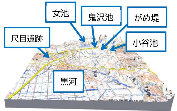
3D表示した富山県射水市黒河